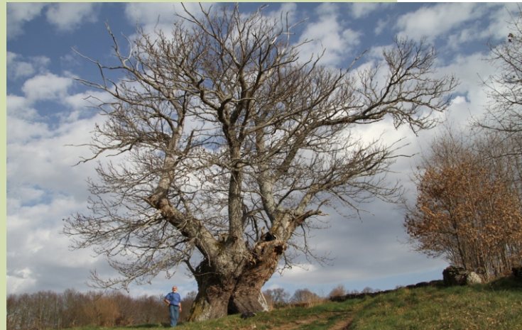
Castiñeiro en Seoane de Abaixo (Caldesiños), 8,2 m de perímetro