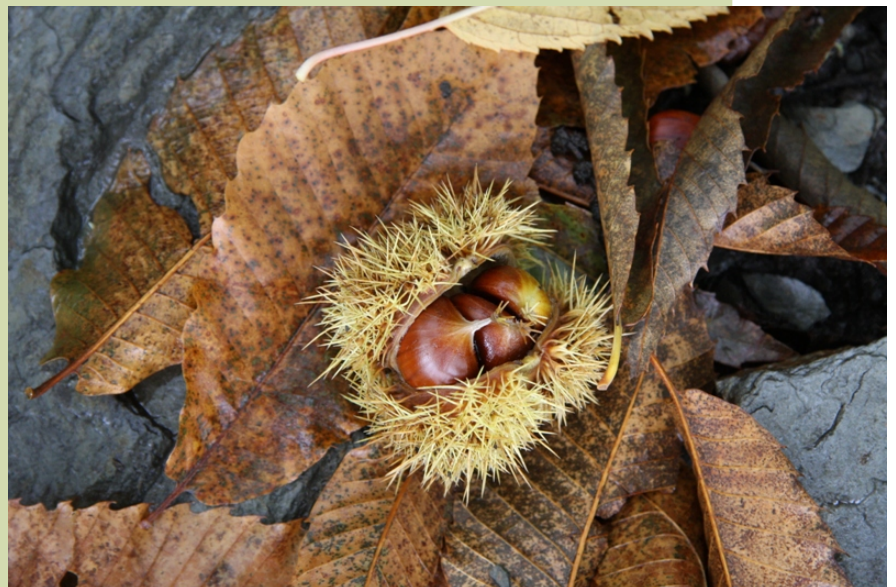
Follas, ourizos e castañas