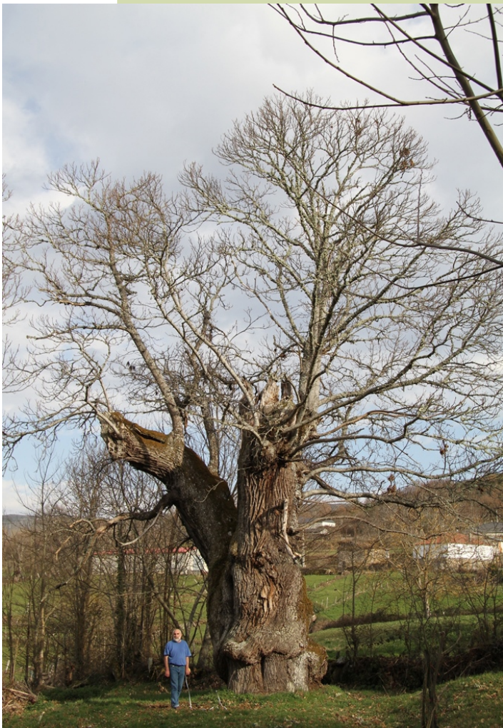
Castiñeiro en (Seoane de Arriba, Solbeira), 8,2 m de perímetro