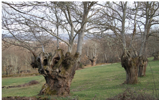
Castiñeiros en Pinza