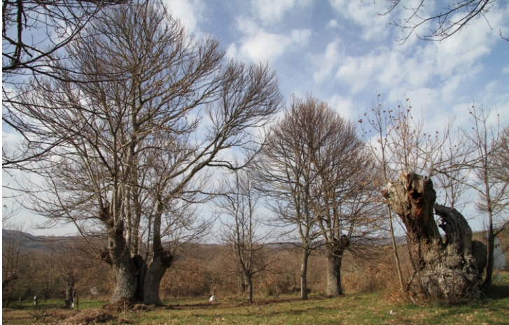
Souto en Caldesiños