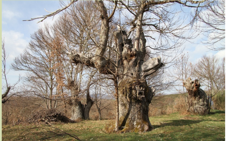
Castiñeiro en Caldesiños (5,9 m de perímetro)