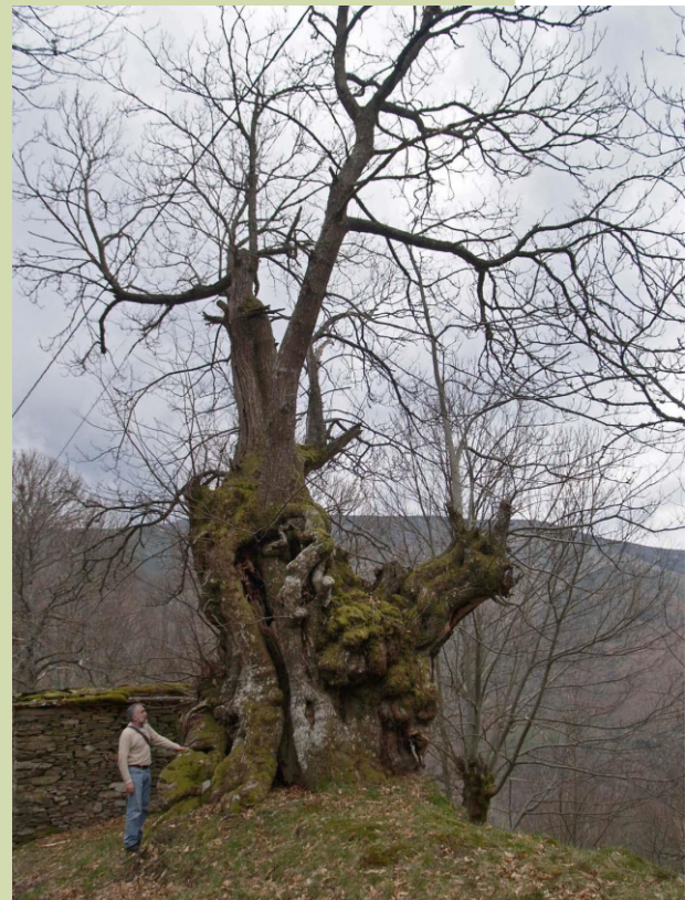
Souto de Dradelo (Taboaza de Umoso)