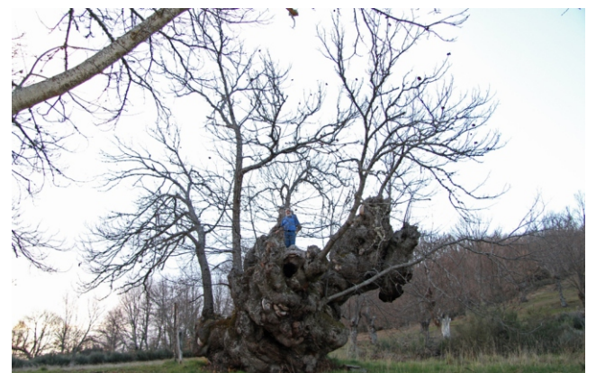
Castiñeiro do Real (Hedroso) de máis de 14 m de perímetro