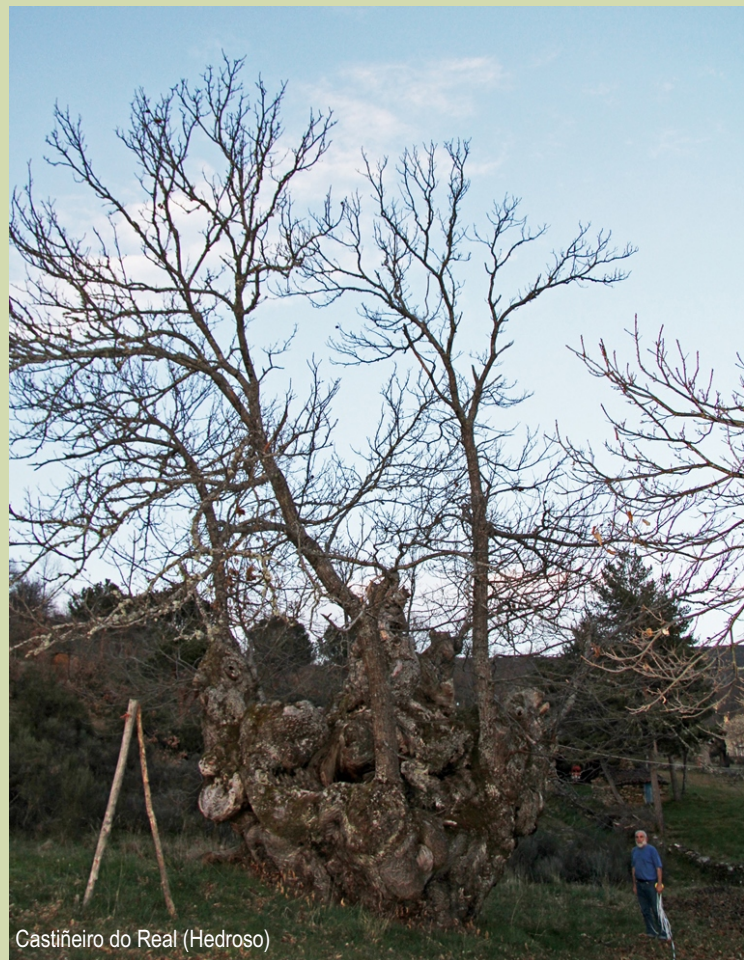
Castiñeiro do Real (Hedroso)