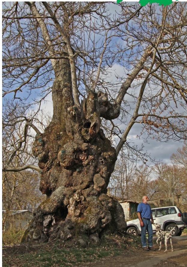
Castiñeiro en Mosexos (Pinza), 7,8 m de perímetro