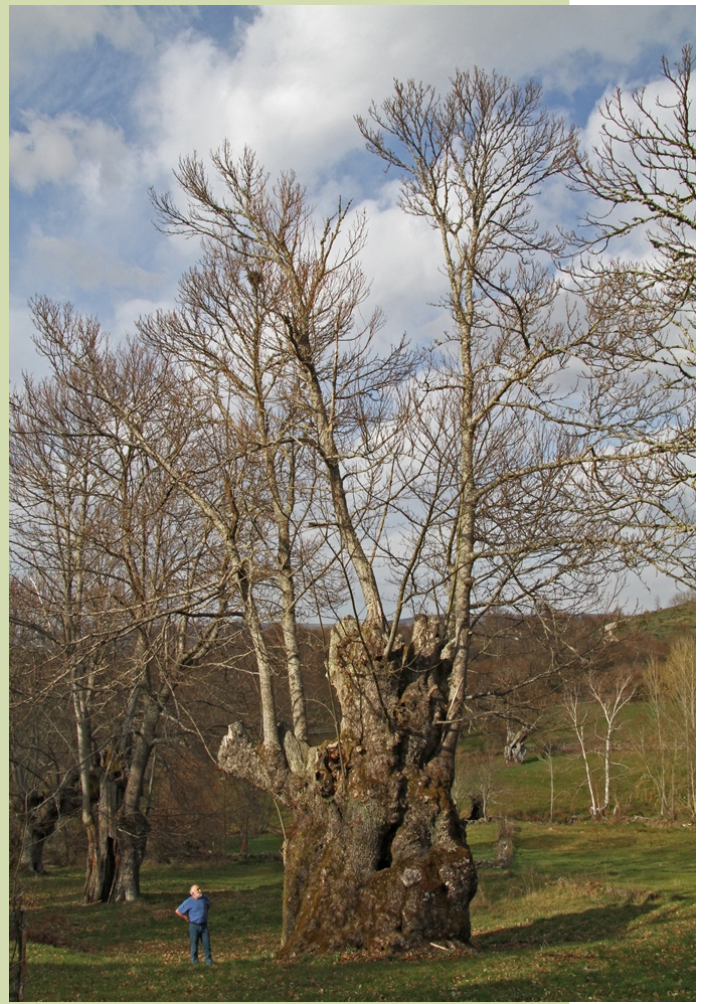
Castiñeiro do Souto do Prado da Parranda (Seoane de Arriba, Solbeira), 12,2 m de perímetro