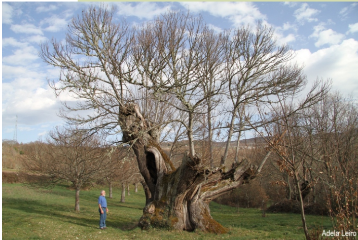
Castiñeiro en Caldesiños (8,10 m de perímetro)