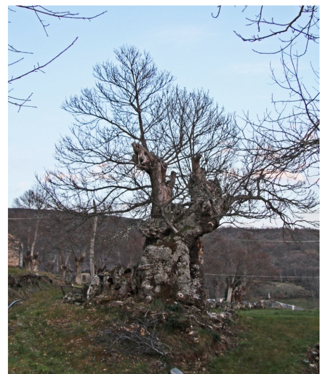
Castiñeiro en Hedroso