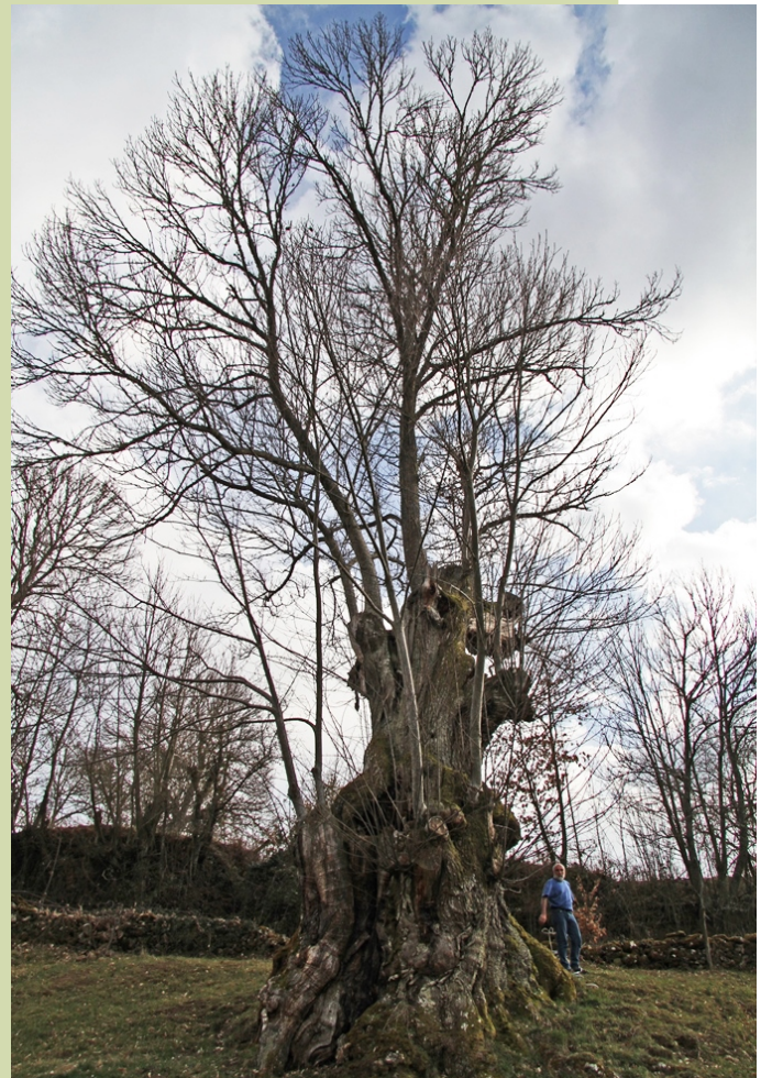
Castiñeiro en (Seoane de Arriba, Solbeira), 9,65 m de perímetro