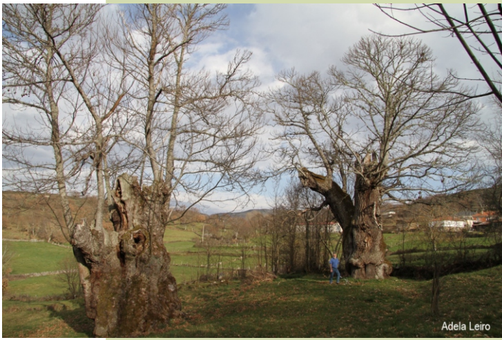
Souto do Prado da Parranda (Seoane de Arriba, Solbeira)