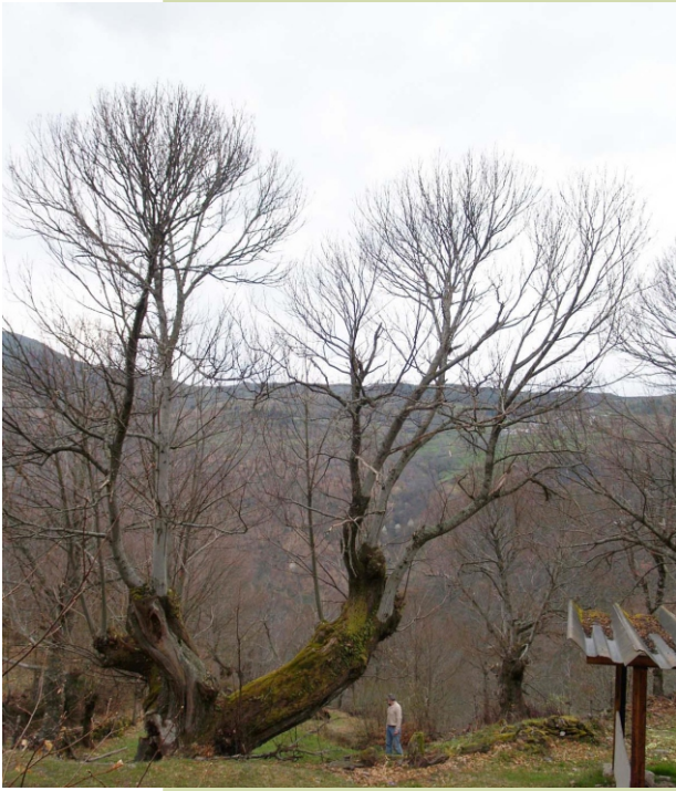
Castiñeiro de Cerdedelo-Umoso (Quintela de Umoso - Viana do Bolo)