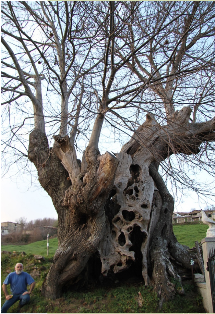
Castiñeiro de Hedroso (8,7 m de perímetro)