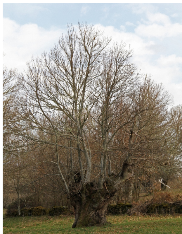
Castiñeiro en Pinza

O concello de Viana do Bolo atópase entre o Macizo Central e as Serras Orientais polo que ten un territorio de releve moi complexo con grandes variacións altitudinais entre as montañas e os fondos dos vales escavados polos ríos Camba e Bibeí. É un concello con importantes valores naturais que ten unha ampla superficie protexida dentro dos LICs “Pena Trevinca” e “Macizo Central”. Acolle tamén un rico patrimonio etnográfico e histórico-artístico, no que ocupa un lugar de destaque a celebración do entroido tradicional, e ademais atópase dentro do espazo xeográfico de cultivo da castaña en Galiza, un dos recursos de máis antigüidade da comarca; e foi precisamente este último aspecto o que nos trouxo ata aquí, porque en moitos dos numerosos soutos que se atopan ao pé de case todas as localidades hai exemplares de castiñeiros de toros monumentais, algúns dos de máis perímetro de Galiza, e o mellor momento para poder apreciar o seu tamaño e a súa monumentalidade é agora cando xa perden as follas e as formas e os pormenores, que antes estaban agochados por elas, déixanse ver e pódense gozar con todo detalle.