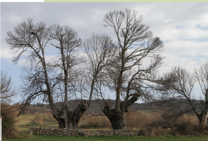
Castiñeiros Seoane de Abaixo Caldesiños), 8,4 m de perímetro