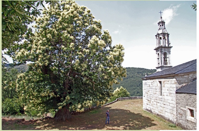
Castiñeiro do Santuario do Pai Eterno. (Quintela de Umoso. Viana do Bolo)