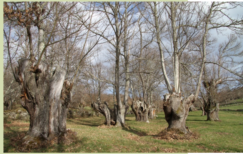
Castiñeiros en (Seoane de Arriba, Solbeira)